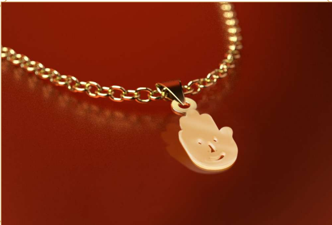
آویز طلا مدل لوگوی باسلام