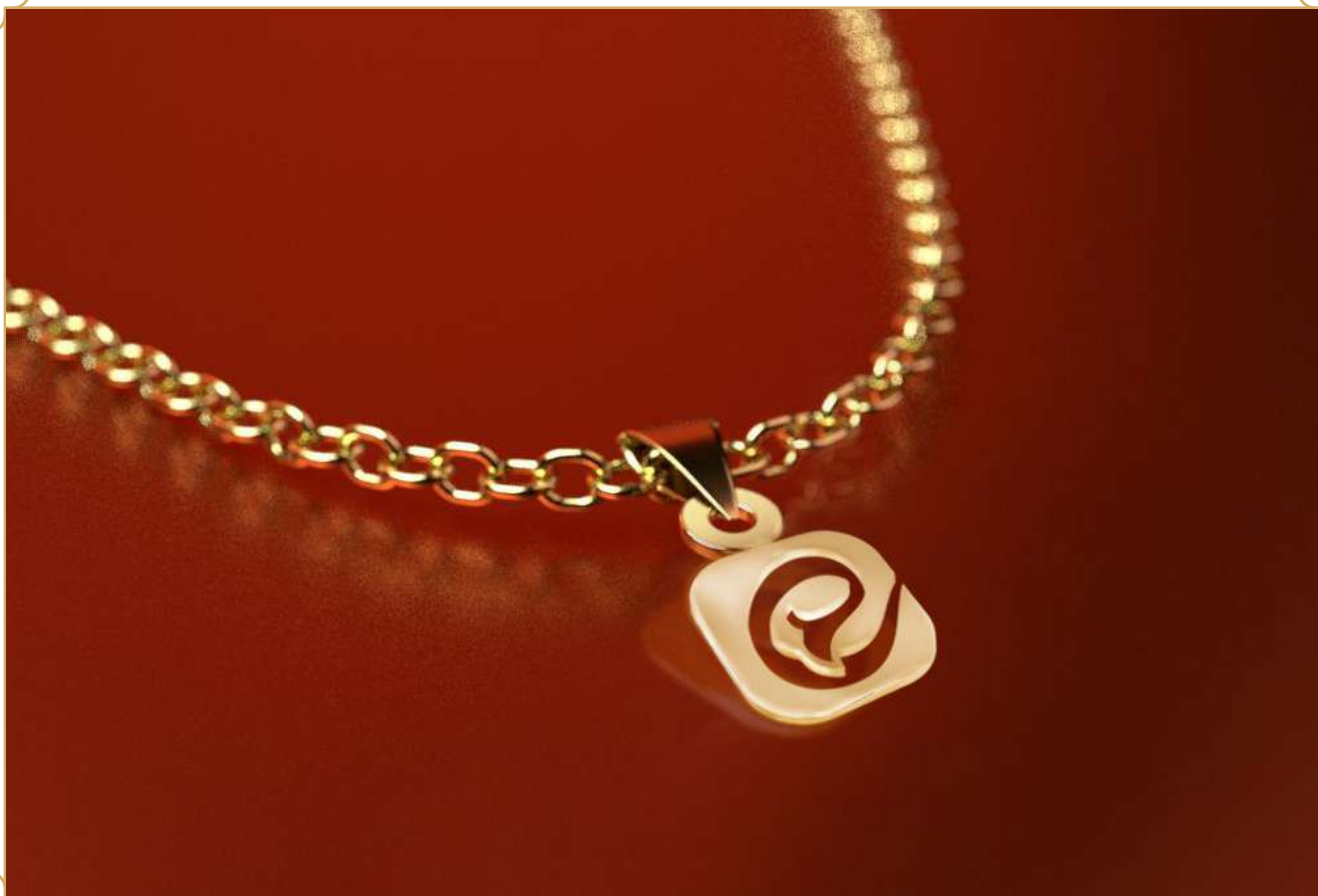
آویز طلا مدل لوگوی ایتا