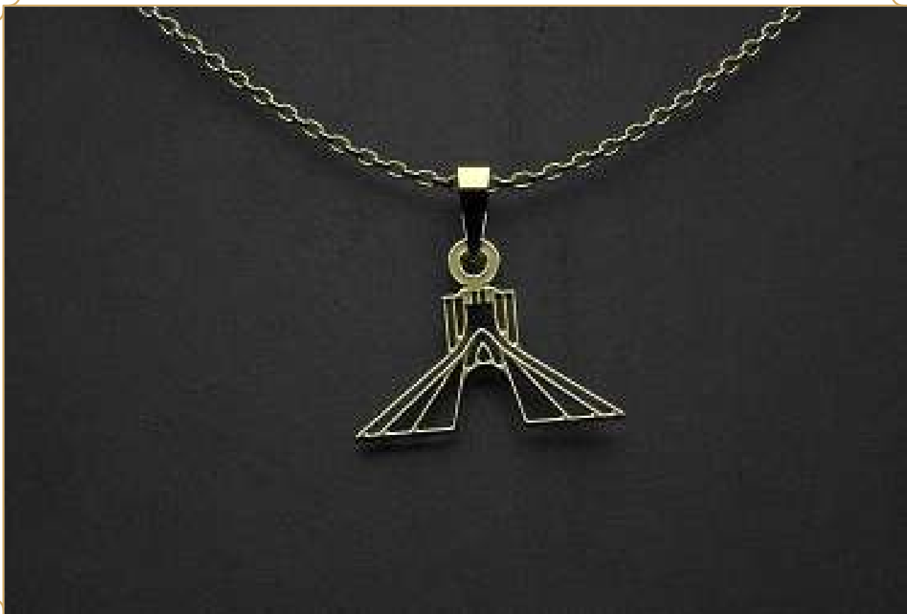
آویز طلا مدل برج آزادی