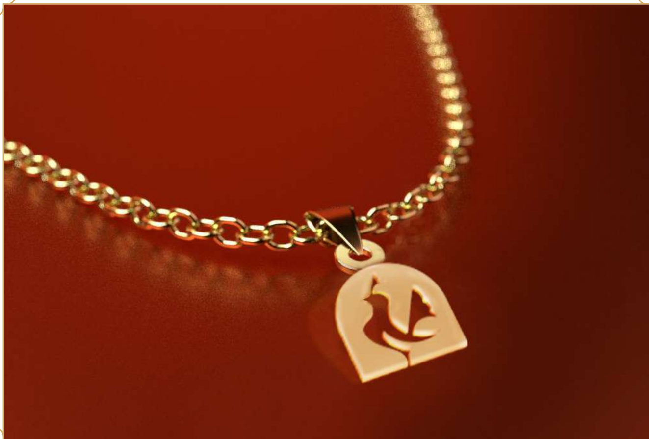
آویز طلا مدل مرغ ماهد